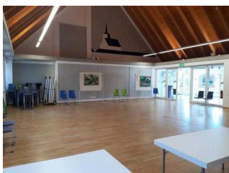
Bürgersaal im 1. OG