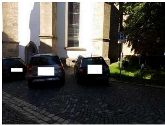
Parkplatz am Rathaus für Menschen mit Behinderungen