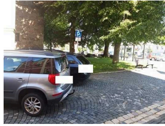
Parkplatz am Rathaus für Menschen mit Behinderungen