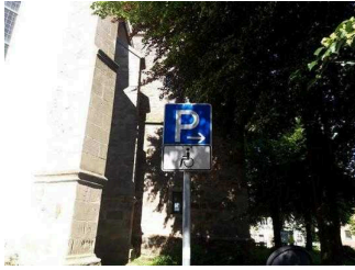
Parkplatz am Rathaus für Menschen mit Behinderungen