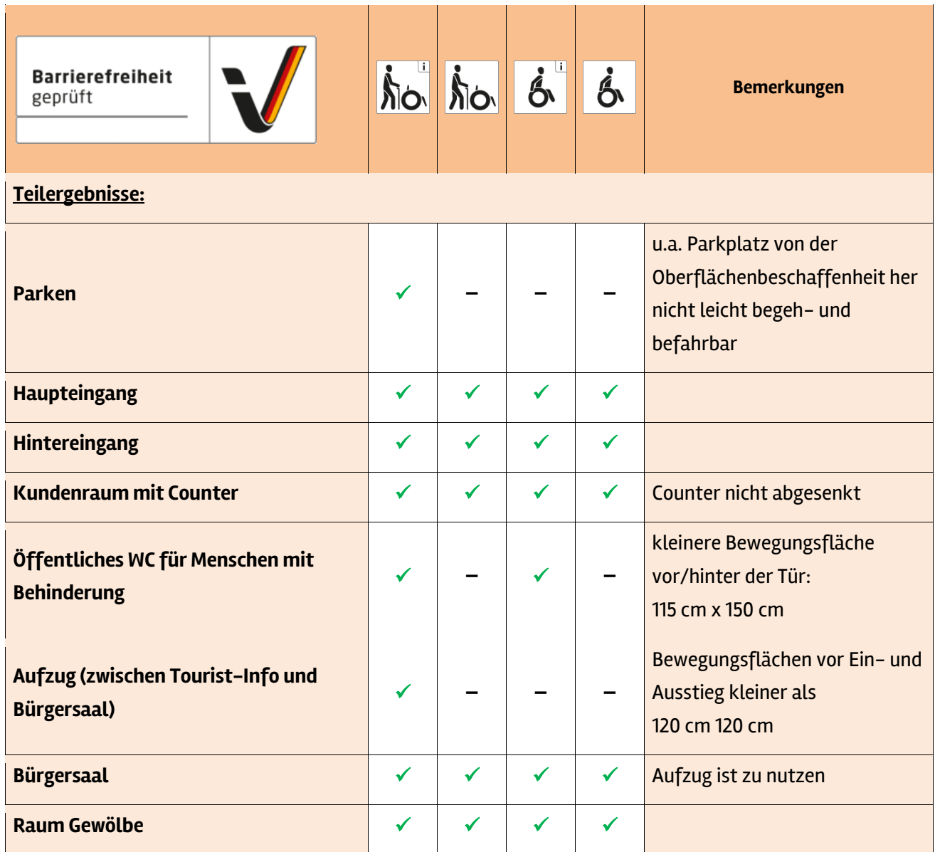
Tabelle 1: Überblick über das Prüfergebnis