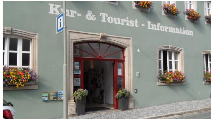
Kur- und Tourist-Information Weissenstadt