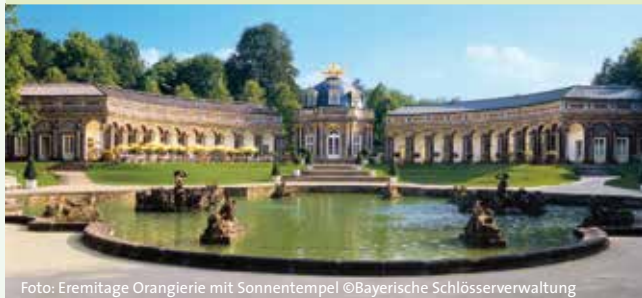
Foto: Eremitage Orangerie mit Sonnentempel ©Bayerische Schlösserverwaltung

Plassenburg , Kulmbach (45 km) Neues Schloss , Bayreuth (40 km) Schloss Fantaisie , Donndorf (43 km) Eremitage , Bayreuth (36 km) Theresienstein , Hof (30 km) Bürgerpark Katharinenberg , Wunsiedel (16 km)