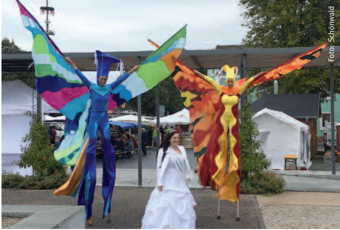
Buntes Treiben bei der offiziellen Übergabe der Neuen Mitte in Schönwald.