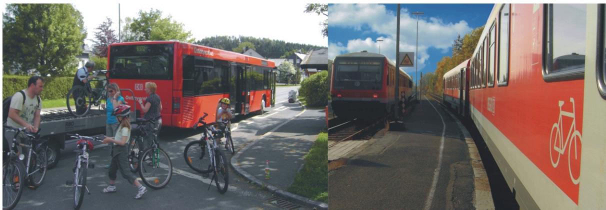
Die Fahrradbusse und Bahnen als Schleplifte: auf- bzw. einladen, hochchauffieren lassen, aus- bzw. abladen, talwärts rollen

Ein neu konzipiertes, kostenloses Faltblatt mit den Fahrplänen, Ausflugstipps, Wander- und Radtourenvorschläge ist in den Gemeinden, den Landratsämtern, den Touristinformationen und bei den Verkehrsunternehmen erhältlich. Einen breiten Raum nehmen ab dieser Saison Radtourvorschläge für Familien und Gelegenheitsradler ein. Es werden interessante, einfache und vor allem nahezu steigungsfreie Touren beschrieben. Die Fahrradbusse dienen dabei als Schleplifte, welche die Radler auf die Höhen transportieren. Von dort können diese dann entspannt und genussvoll auf Radwegen oder verkehrsarmen Straßen über weite Strecken talwärts rollen. Der Frankenwald und das Fichtelgebirge werden dank Frankenwald-mobil für die nicht ganz so durchtrainierte Klientel bzw. für Familien mit Kleinkindern ebenso das, was es für die Radsportler bereits ist - zum Radparadies.