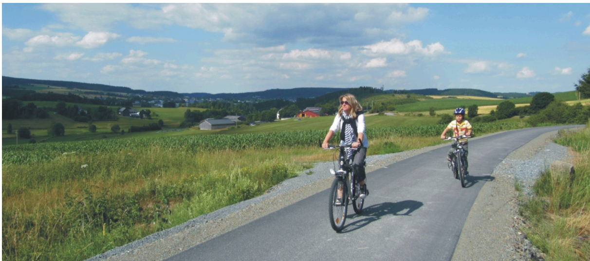
Der neue Radweg auf ehemaliger Bahntrasse zwischen Schwarzenbach a. Wald (Einstieg 685m) und Naila (Bahnhof 500m)

Zusätzlich erhält die Hochfrankenwaldlinie ab der Saison 2011 einen Fahrradanhänger mit 40 Stellplätzen. Damit dürften die bei schönem Wetter manches Mal aufgetretenen Kapazitätsengpässe auf dieser Linie während der ersten und der letzten Bergfahrt der Vergangenheit angehören.